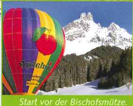
Start vor der Bischofsmütze.