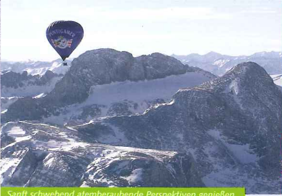
Sanft schwebend atemberaubende Perspektiven genießen.