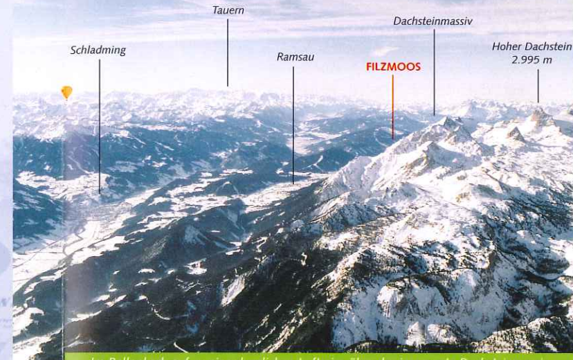
Im Ballonkorb auf zu einer herrlichen Luftreise über das imposante Dachsteinmassiv.