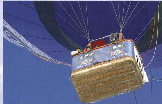
Abheben in einen tiefblauen Winterhimmel.

Die wunderschöne verschneite Bergwelt, die faszinierende Winterlandschaft mit einer fantastischen Fernsicht, soweit, bis sich die Erde krümmt und extra lange Fahrten sind Anreize, die keinen Ballonpiloten und Passagier in den Winterschlaf fallen lassen.